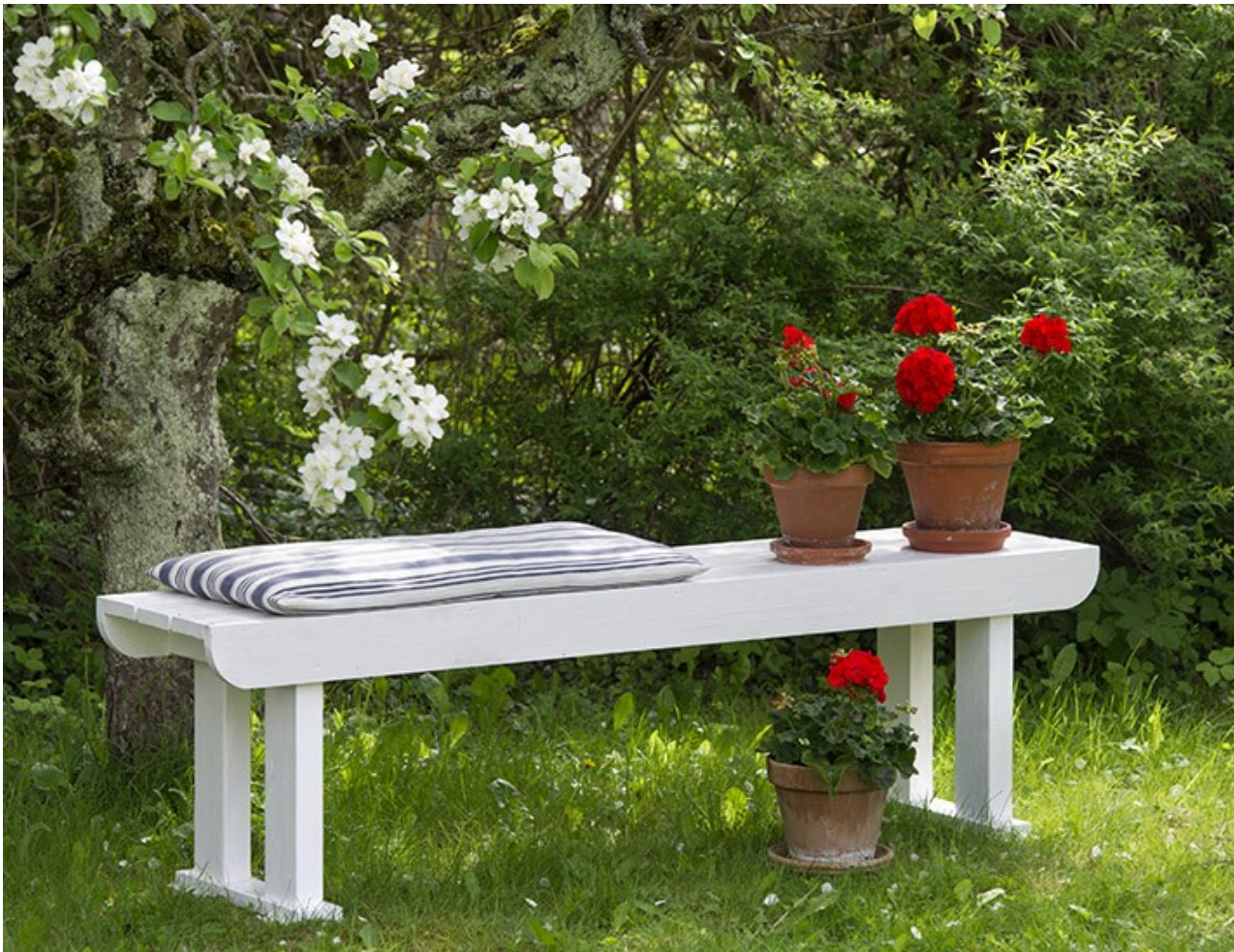
En liten lugebenk for en fredelig plass i hagen. En pute øker sittekomforten.

Denne koselige hagebenken passer bra som "lugebenk" i kveldssolen, og gir noen ekstra sitteplasser når du dekker langbord ute. Den er enkel å bygge, så hvorfor ikke bygge to når du først er i gang?