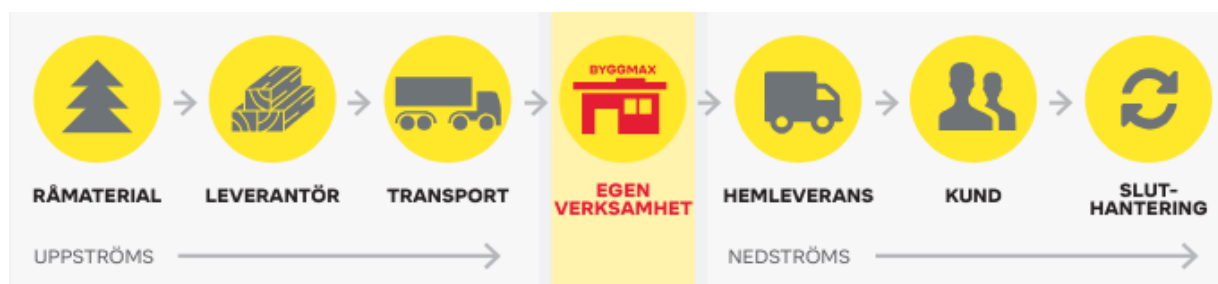
Bilde fra års- og bærekraftsrapporten for 2023