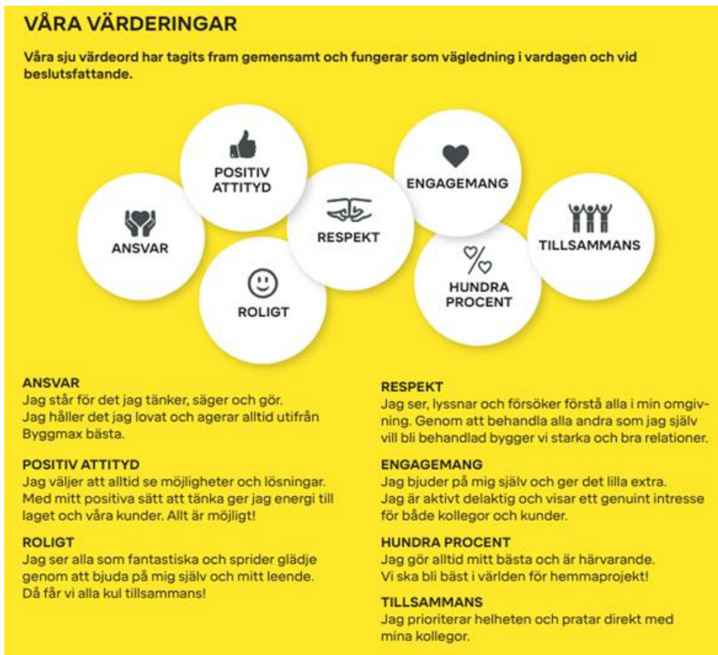
Bilde fra års- og bærekraftsrapporten for 2023